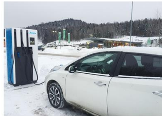
電動車充電解決方案