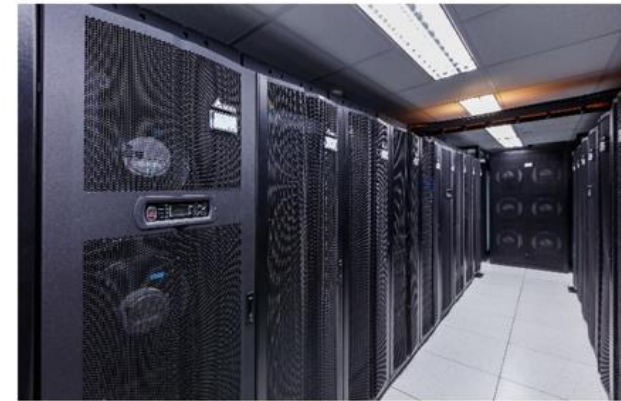
資料中心解決方案