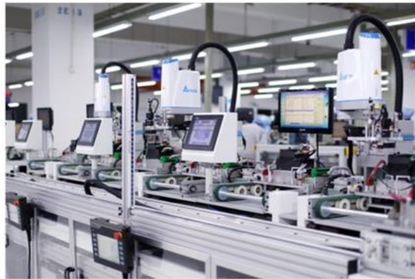
工業自動化與智能製造 解決方案