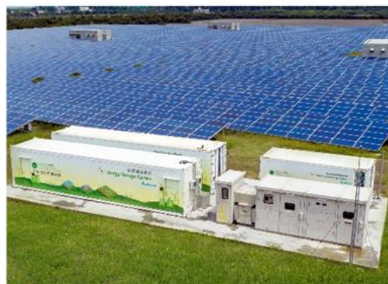
智慧能源解決方案