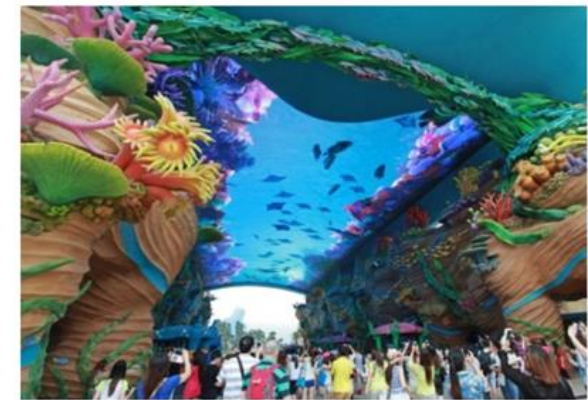
視訊與監控解決方案