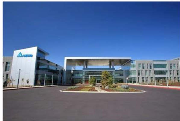
樓宇自動化解決方案