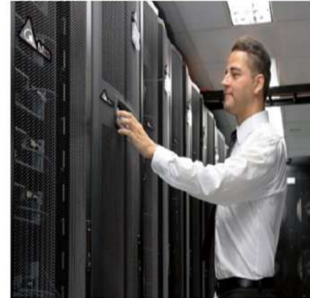
資料中心解決方案