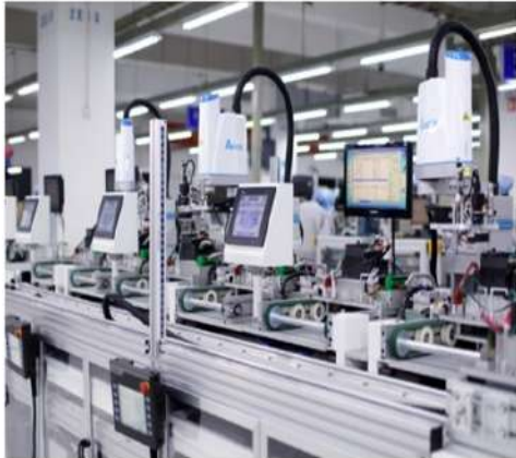
工業自動化與智能製造 解決方案