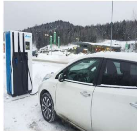
電動車充電解決方案