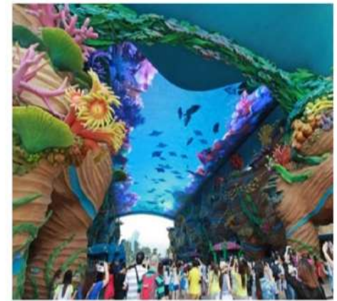
視訊與監控解決方案