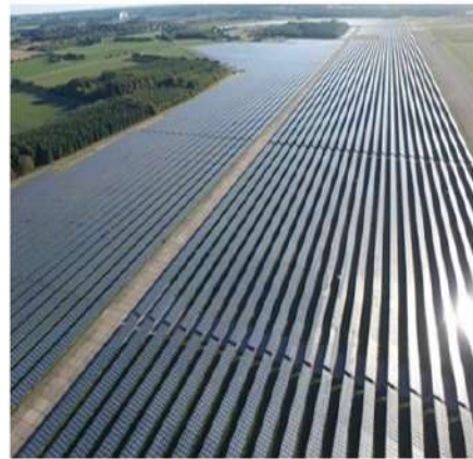
可再生能源解決方案