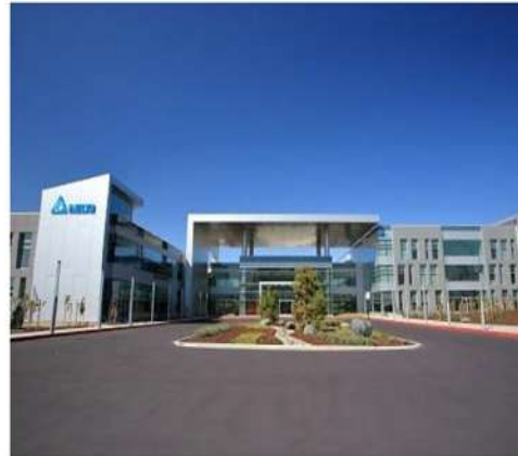
樓宇自動化解決方案