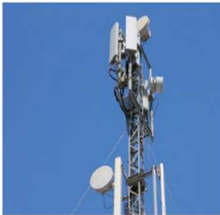
通訊電源解決方案