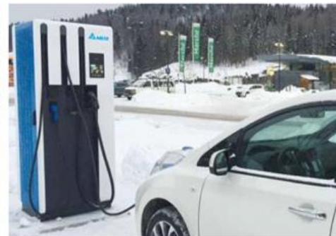
電動車充電 解決方案