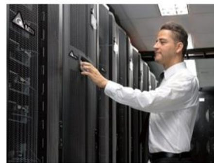
資料中心 解決方案