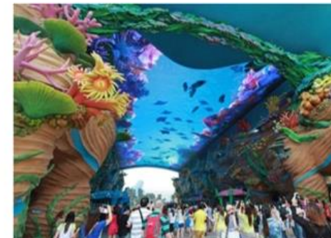
視訊與監控 解決方案