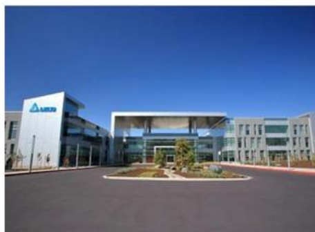
樓宇自動化 解決方案