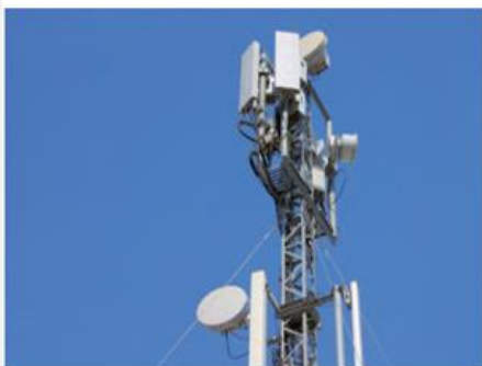
通訊電源 解決方案