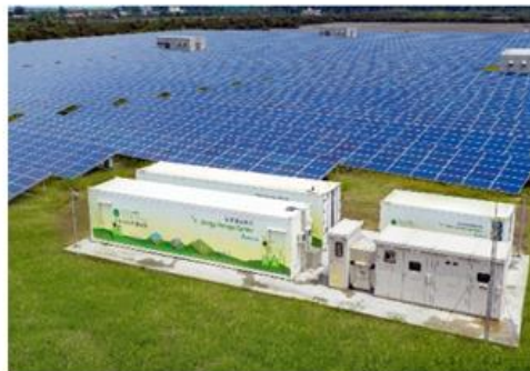
智慧能源 解決方案