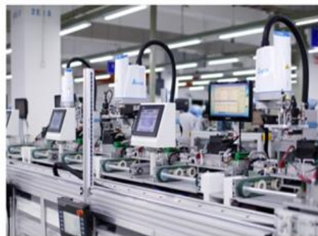
工業自動化與 智能製造解決方案